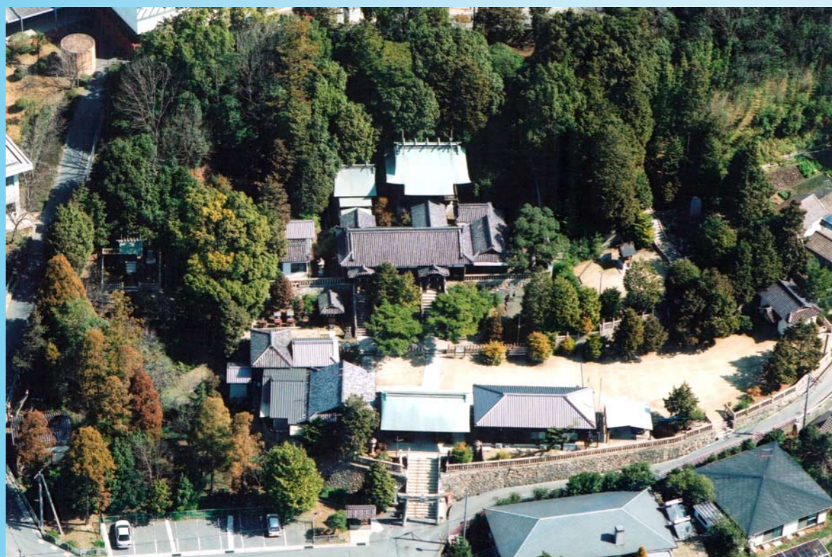
神社全景航空写真（平成 18 年撮影）