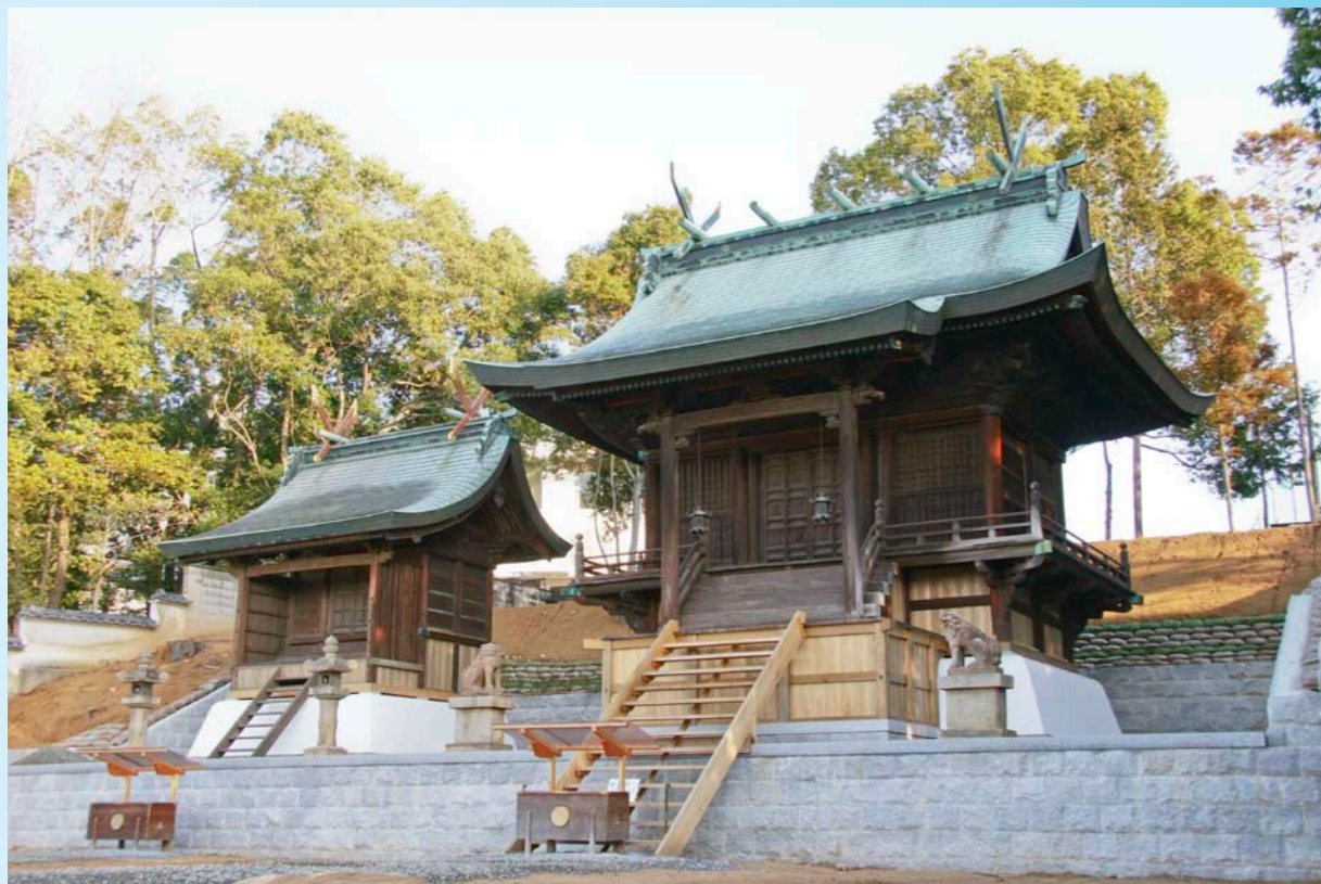
移設が完了し新年を迎える両本殿（平成 19 年 12 月）