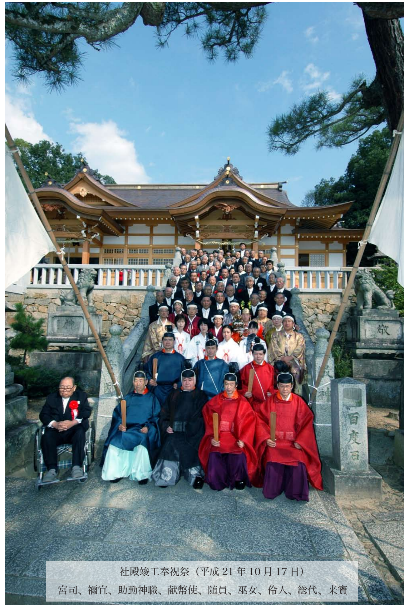
社殿竣工奉祝祭 (平成 21 年 10 月 17 日) 宮司、禰宜、助勤神職、献幣使、随員、巫女、伶人、総代、来賓