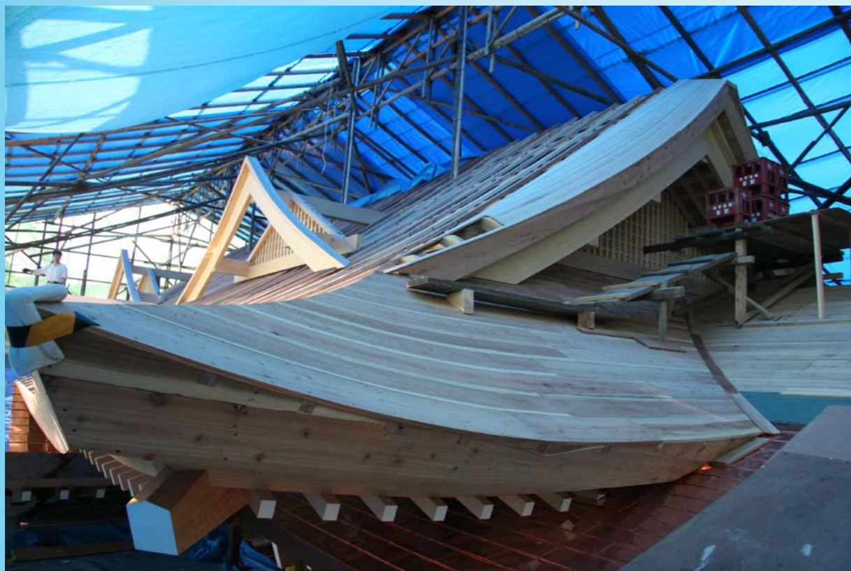
千鳥破風が付けられた社殿 (平成 21 年 4 月)