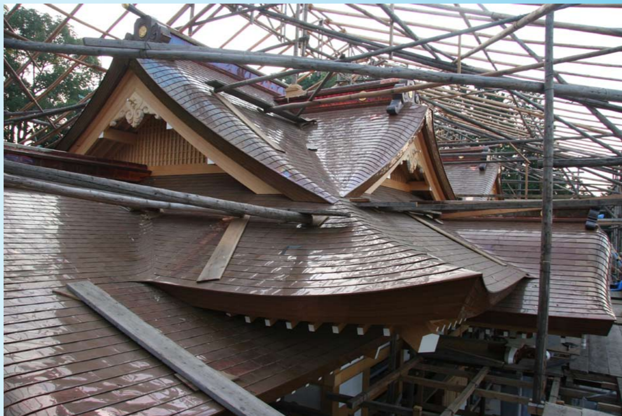
覆屋が外された社殿 (平成 21 年 8 月)