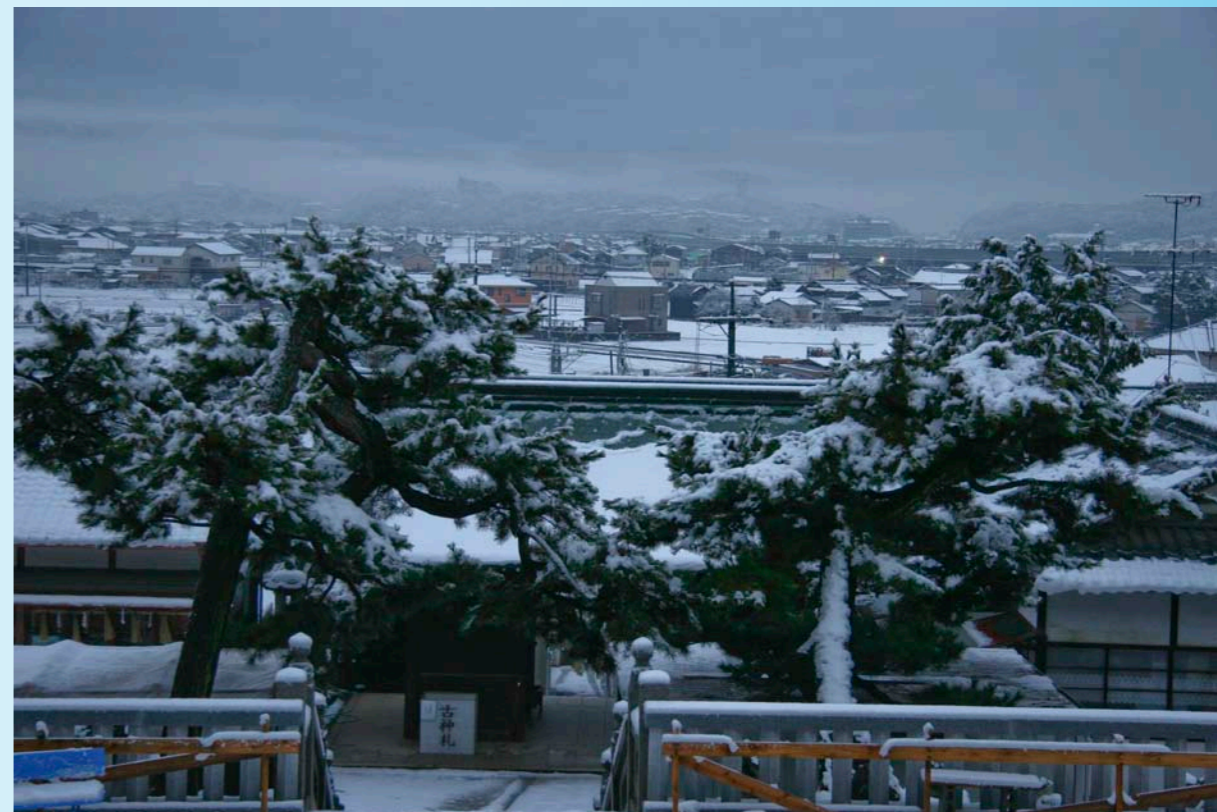
雪の境内から西田を望む（平成 20 年 1 月）