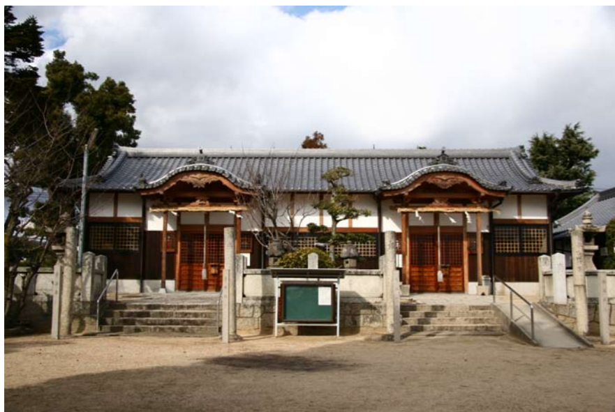
唐破風の向拝一對の箕島神社拝殿

双殿造りの拝殿を持つ近隣の神社 箕島神社 （岡山市南区箕島二三三五一） 箕島西部の八幡宮（品陀和気命）と東部の汗入御崎宮（櫛振命）を境内に遷し、箕島神社と改称した。 明治十二年村社に列格。明治十四年幣殿・拝殿・神供所を移転造営。平成十三年幣拝殿改築。双殿造りの拝殿には唐破風の向拝一對が付く。