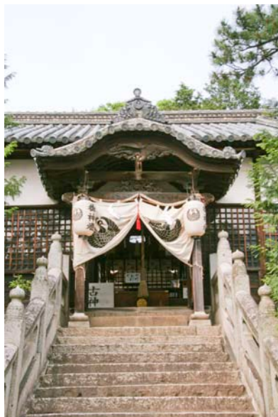
鶴崎神社側向拝正面