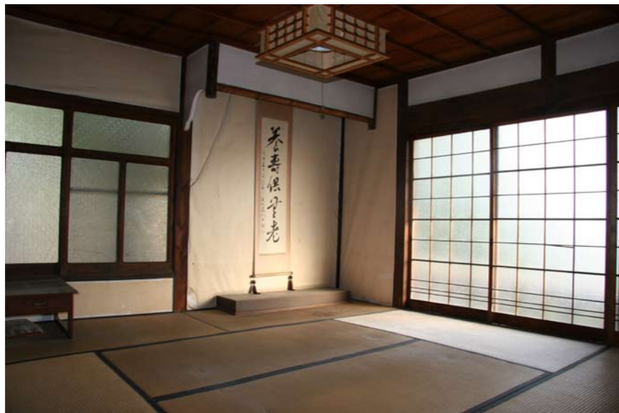
拝殿神務室八畳（旧貴賓室）