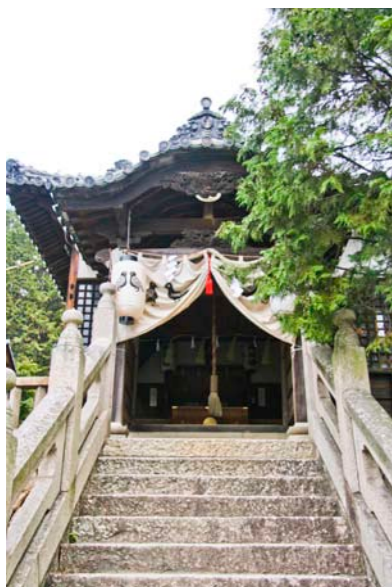
八幡神社側向拝正面