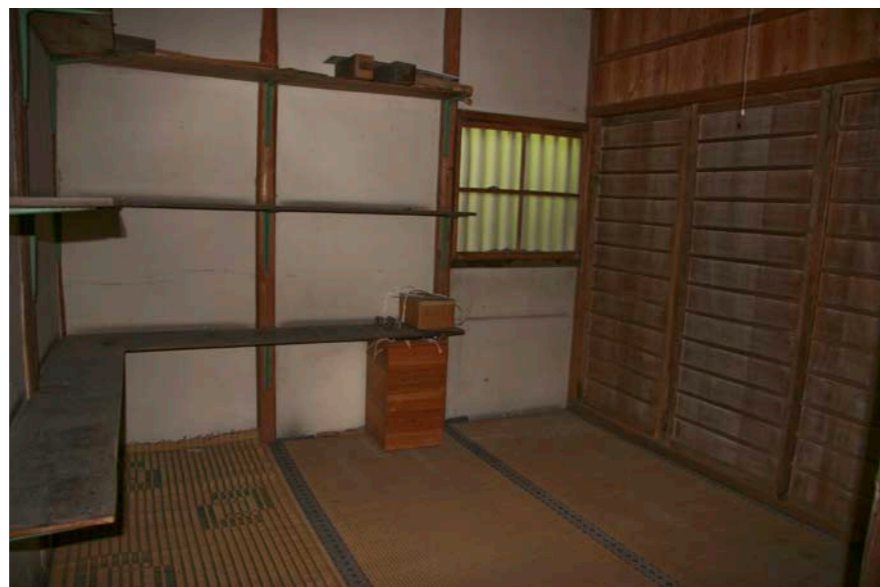
神 饌 所