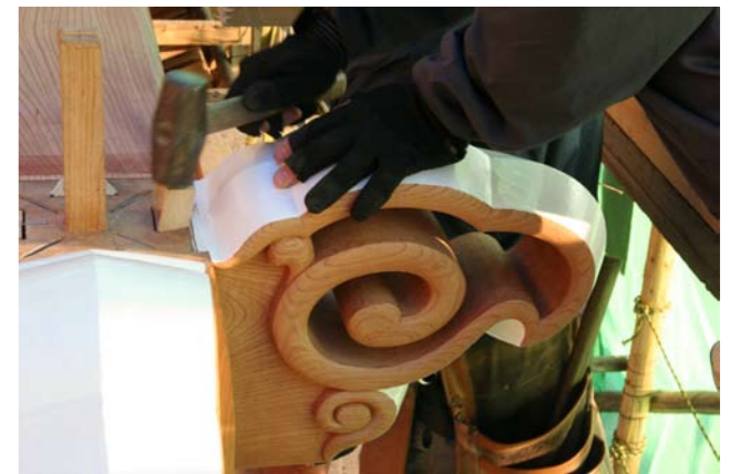
57 虹梁に設置される木鼻