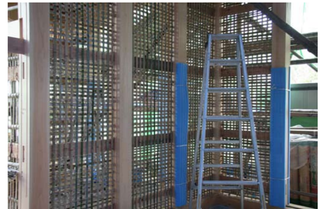
2 土壁の骨組みとなる小舞竹