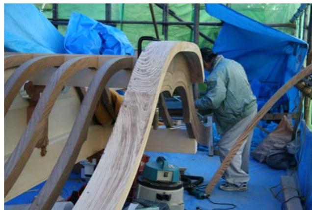
6 向拝の破風板に取り付けられた裏甲