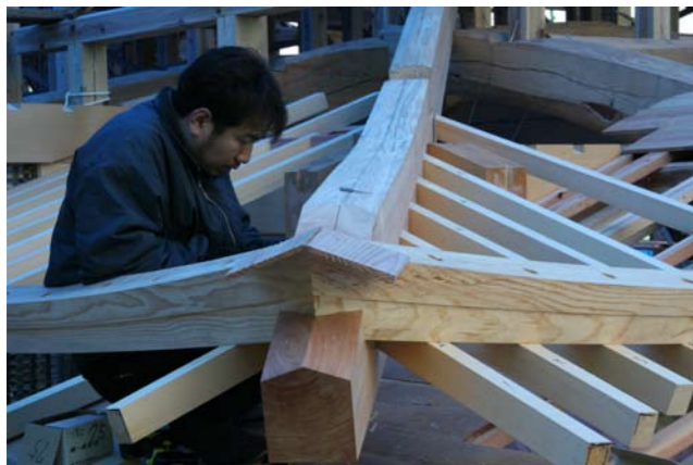
5 隅木に取り付けられた茅負