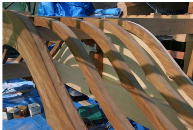
4 向拝唐破風の飛檐垂木