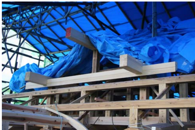
11 千鳥破風の桁に連結された前包