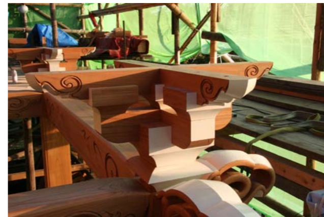
58 虹梁の上に設置された栴組