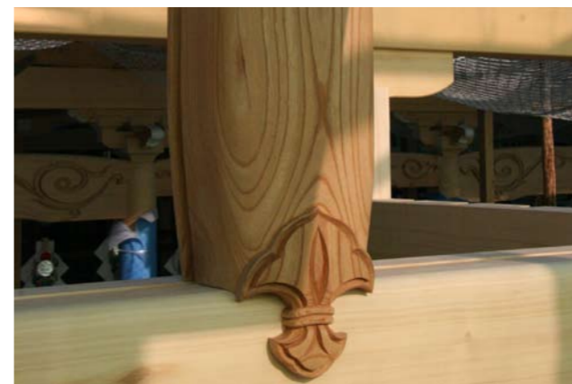
60 桁の間に設置されたカブラ形の太平束