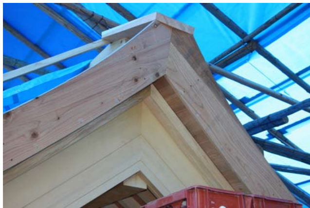
9 軒付けの頂上に取り付けられた鬼板を乗せる鬼座