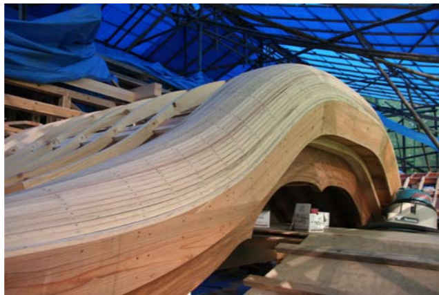
10 向拝唐破風の箕甲垂木