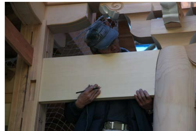
1 丸柱の曲線に合わせて取り付けられる化粧貫