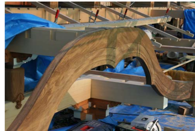
3 向拝唐破風の破風板