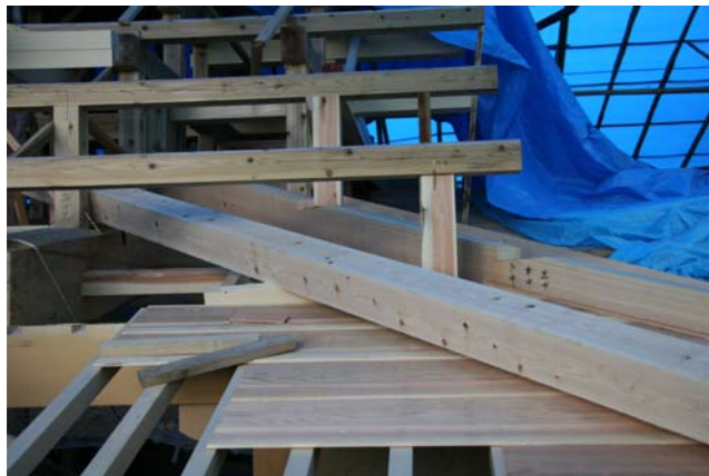
7 茅負に連結された桔木 (手前)