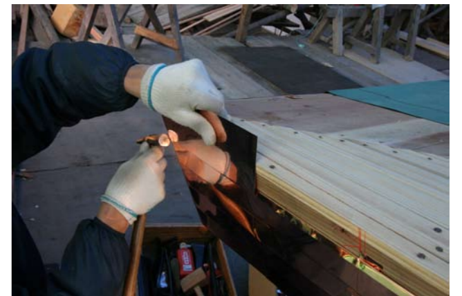
6 厚さ 0.3 mm の銅板で5段葺きされる軒付け