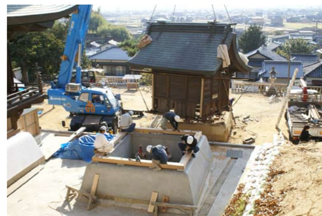
⑬大型クレーンにより八幡神社本殿移設