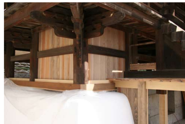
⑪鶴崎神社本殿腰板張り