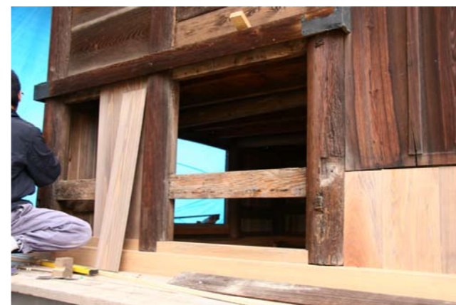
⑭八幡神社本殿腰板張り