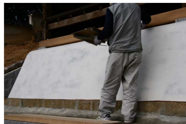
⑮八幡神社本殿亀腹漆喰塗り