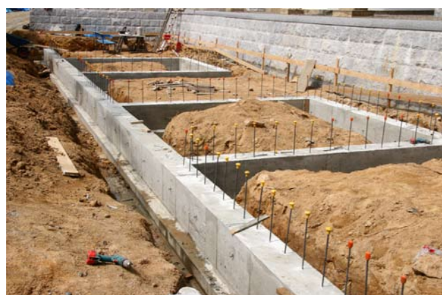
⑧社殿地中梁 (厚さ 30 cm、鉄筋 19 mm と 13 mm) 基礎