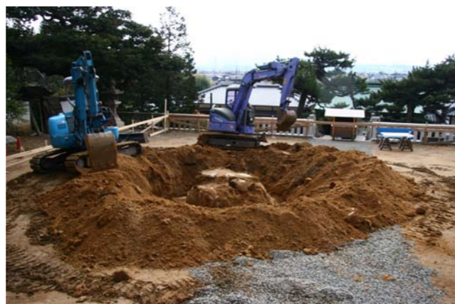
③祭神の吉備津彦命休息岩の掘り出し作業