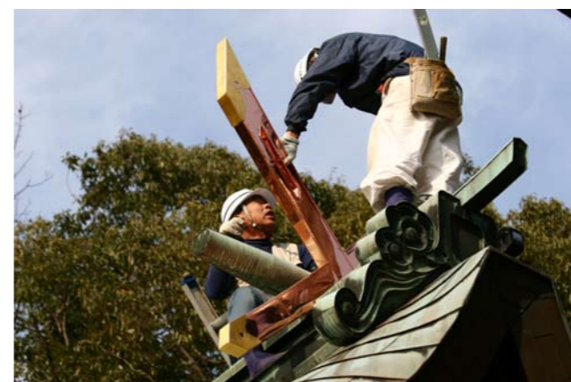
⑩八幡神社本殿千木取り付け