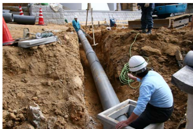
⑤排水用VPパイプ (300 mm) 設置