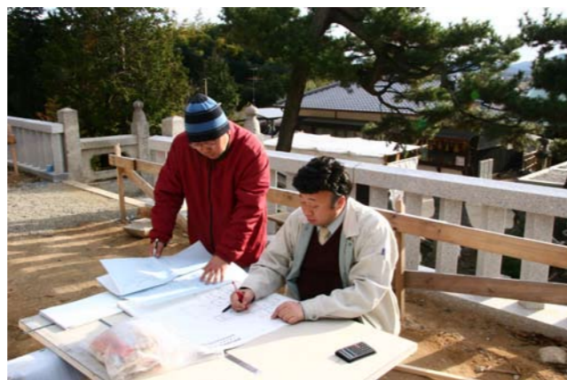
①測量並びに地取り