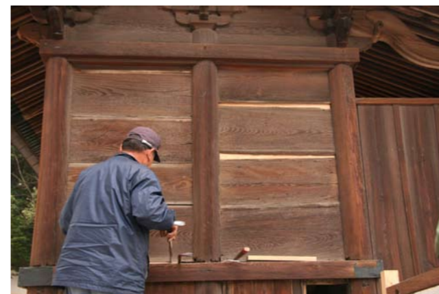
⑫八幡神社本殿壁板締め直し