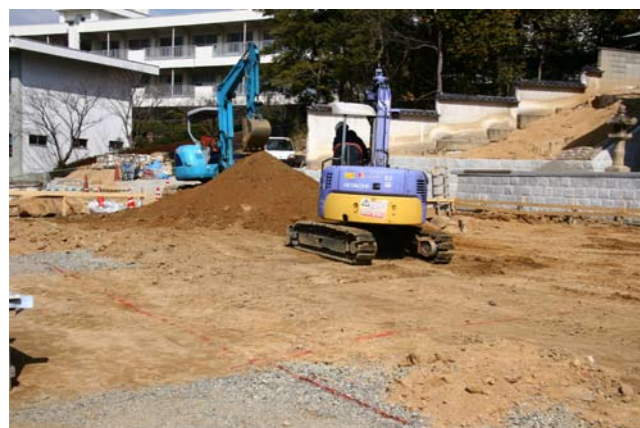
④社殿建設地すき取り作業