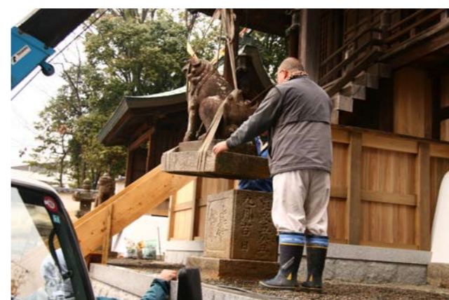
⑯鶴崎神社本殿前に狛犬設置