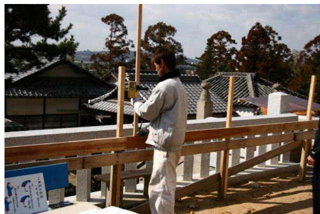
②現場の立体的目印となる丁張り設置