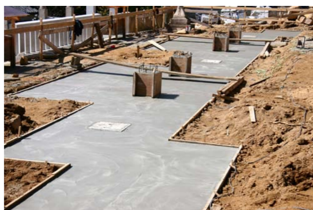
⑦向拝部分にコンクリート基礎打設